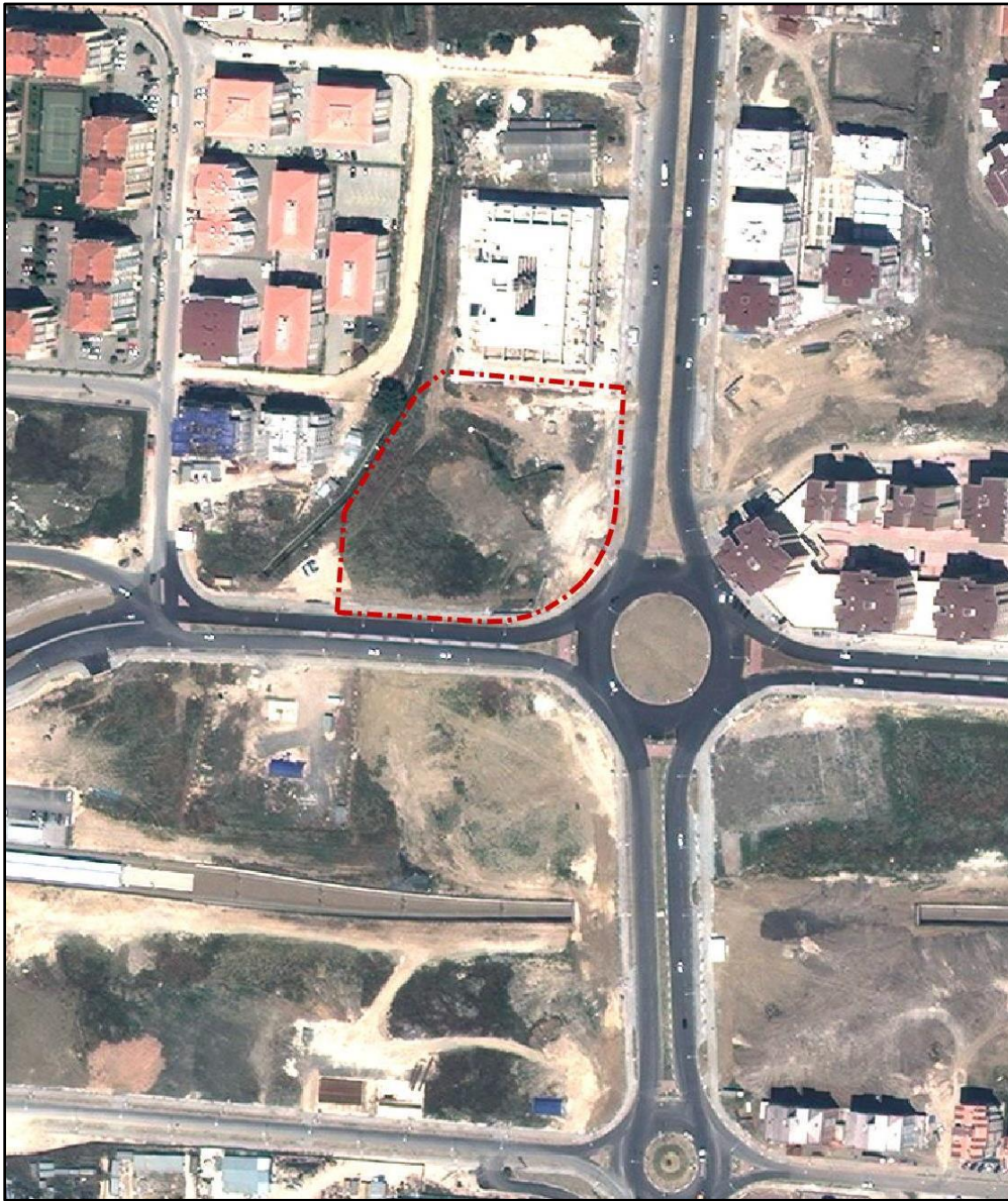
Resim 1: Planlama Alanının Uydu Görüntüsü:

Planlama alanı, 1/5.000 ölçekli Nilüfer Nazım İmar Planı sınırları içerisinde yer almaktadır.